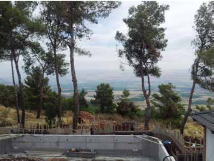
תהליך ההקמה: בניית קירות תמך לצורך יצירת מפלסים.