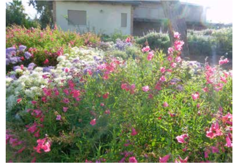
פריחה קיצית בנן התחתון.

הגן חולק למספר מפלסים, כאשר במפלס העליון, השייך לבית המרכזי והיחידות הסמוכות אליו, יצרנו גן עוטף ופחות רשמי בחלקו הקדמי - מדשאה רחבת ידיים עם עצי שדר משולשל (Betula alba), מעטפת שיחים שונים, וכמה עצים קיימים שהיו "דיירים" ותיקים בשטח. בצדו הפנימי והאחורי של הבית יצרנו ירידה קלה ממשטח הישיבה המקורה הצופה אל מדשאה עגולה ומרשימה מעוטרת בפרחי עונה מתחלפים, וממוסגרת בצמחי לבנדר צרפתי (lavandula dentate) ומרוות אפרים (Salvia nemorosa). במפנה המזרחי של אותו המפלס ממוקמים שני מבנים נוספים המשמשים כצימרים לאירוח, ושם שתלנו שיחי גרדניה יסמינית (Gardenia jasminoides) ולבנדר גרוסו (lavandula grosso).