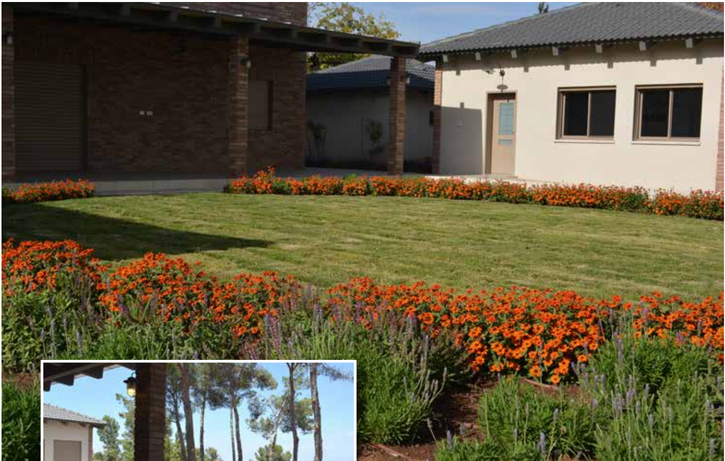
מדשאה עגולה מקבלת בכל עונה מסגרת צבעונית חדשה.