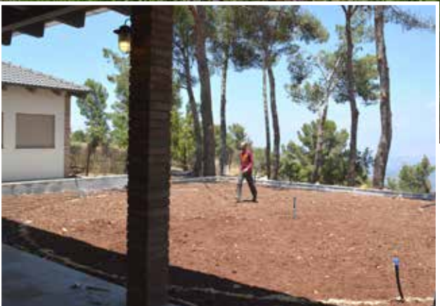
יצירת מדשאה עגולה.