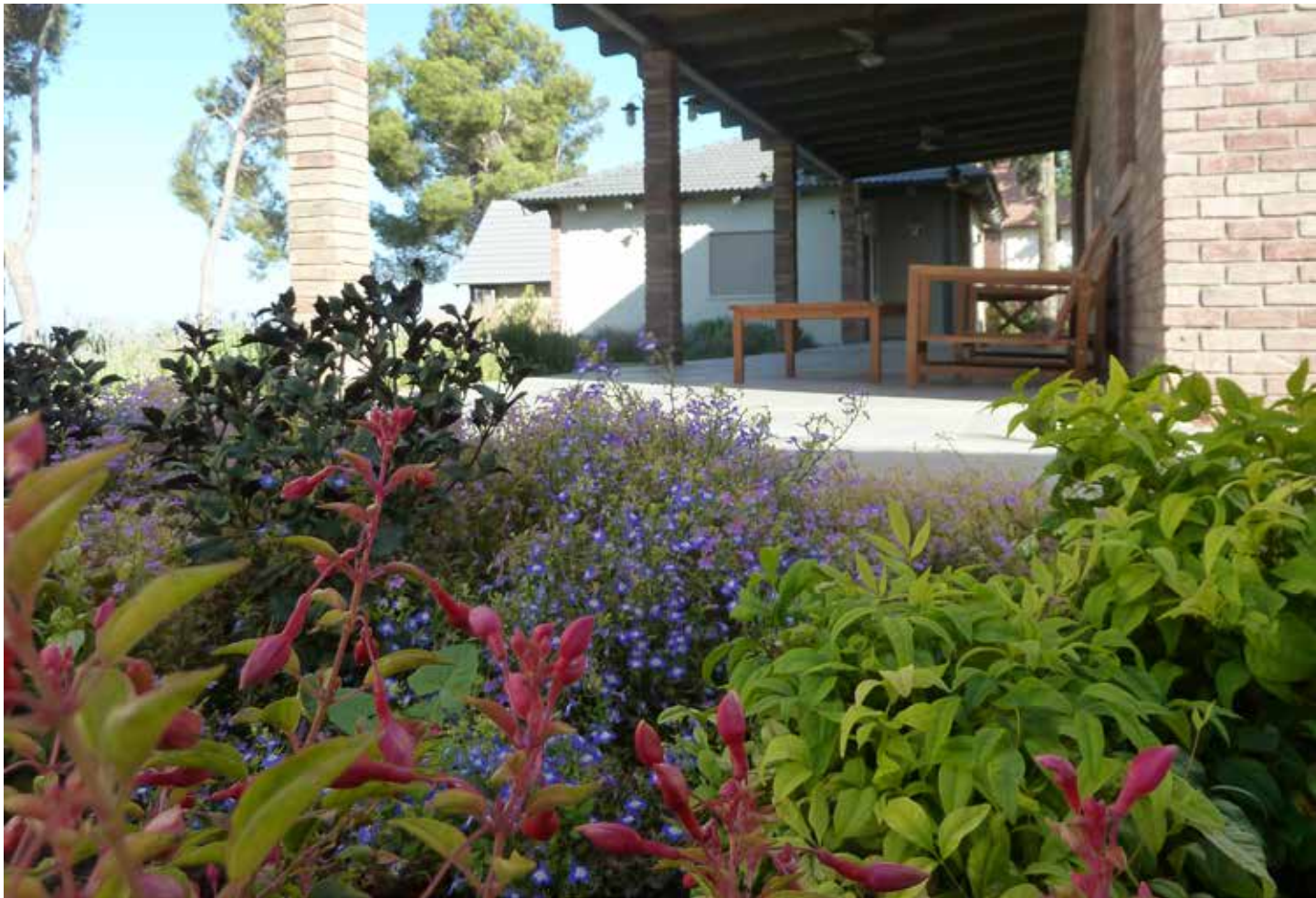
פינת ישיבה מול נוף העמק מלווה בפוקסיות, קמליות, לובליות, ננדינות.

הבית והגן ממוקמים בהרי הגליל העליון, בשטח הגובל ביער אורנים רחב ידיים המקיף את הישוב. מחד, תנאי פתיחה טובים לתכנון גן בסגנון הרצוי שכולל את הצמחייה המבוקשת, ומאידך, תנאי הקרקע, האקלים המקומי ועצי אורן וברוש שהיו קיימים בשטח דרשו חשיבה והתחשבות מיוחדת. בשלב הראשון קבענו ציר מרכזי לגן- ציר ש"נמתח" מרחבת היציאה מהסלון, עובר דרך גן פתוח ורחב ומוביל לכיוון החורש הטבעי שבהמשכו. אחד מעצי האורן הקיימים שהיה קרוב מאד לציר זה, הכתיב יצירת מפלס עם מדרגות מעוגלות סביבו, וכך, למרות שמיקומו של העץ יצר סטייה קטנה מהציר המדויק, השלמנו איתה וסימנו יו על מאפיין ראשון ומשמעותי של זרימת הגן. עץ זה, אגב, נשמר בקפידה במהלך ביצוע עבודות הפיתוח והבניה בשטח, ומטבע הדברים כל יתר העצים הקיימים בגן הם שקבעו את גובהו של המפלס התחתון.