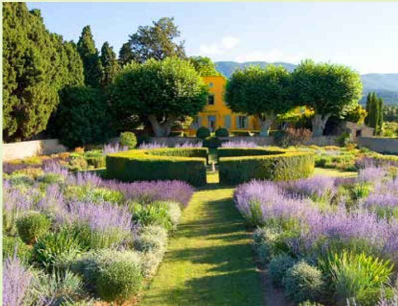
גן בפרובנס, גלון, וויקיפדיה.