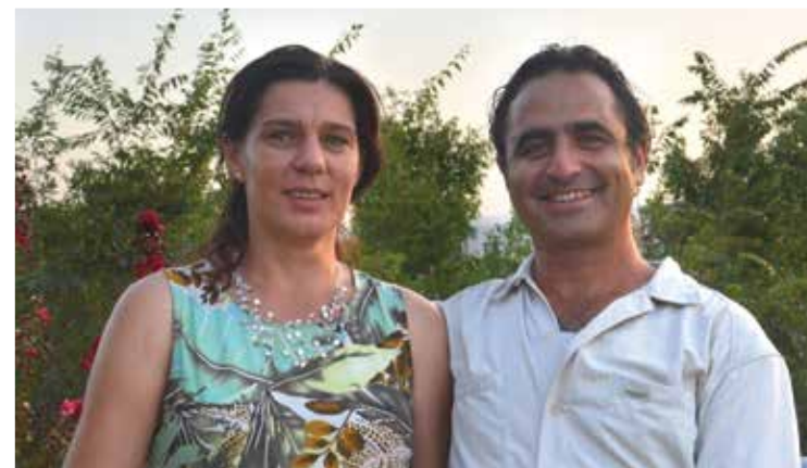
מאת: טניה ושרלי אילוז, חברת גרדינה אור פרויקטים בע"מ

הגן שתכננו מעצבי הגנים שרלי וטניה אילוז בהרי הגליל העליון, חושף אסתטיקה "רשמית" משהו, מבוססת על עקרונות שמייצרים את הסגנון הנקי-מסודר שהדהד לבעליו את ארץ מוצאם