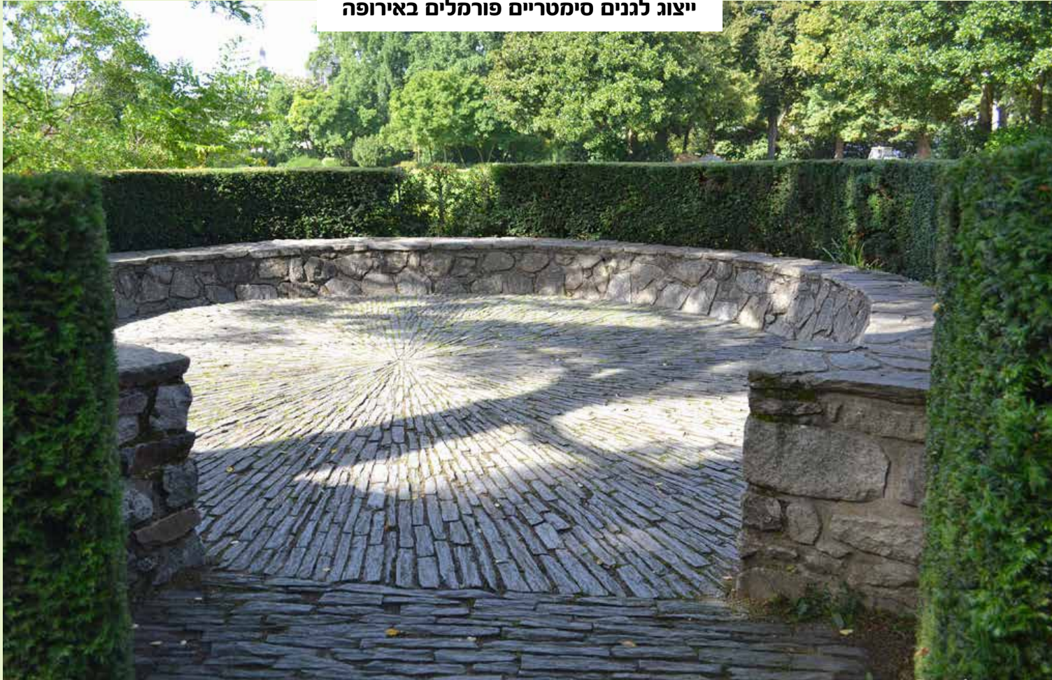
jardin des plantes de Nantes-www.gardener.ru