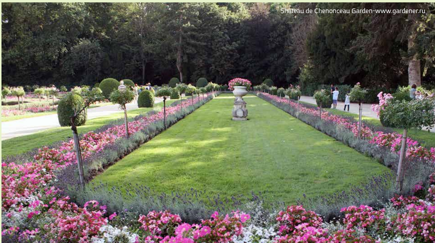
Shateau de Chenonceau Garden