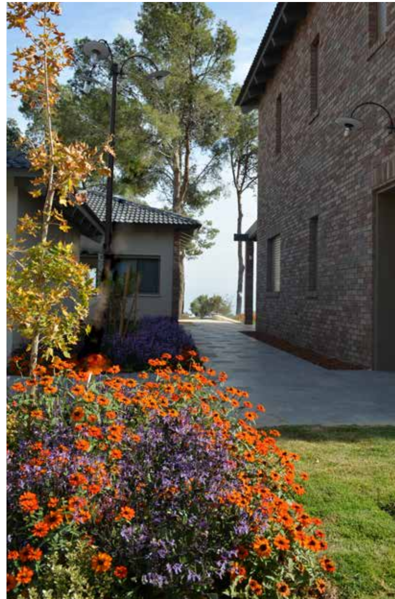
תחילת עונת הסתיו- עצי האדר הצעירים מחליפים את צבעם.