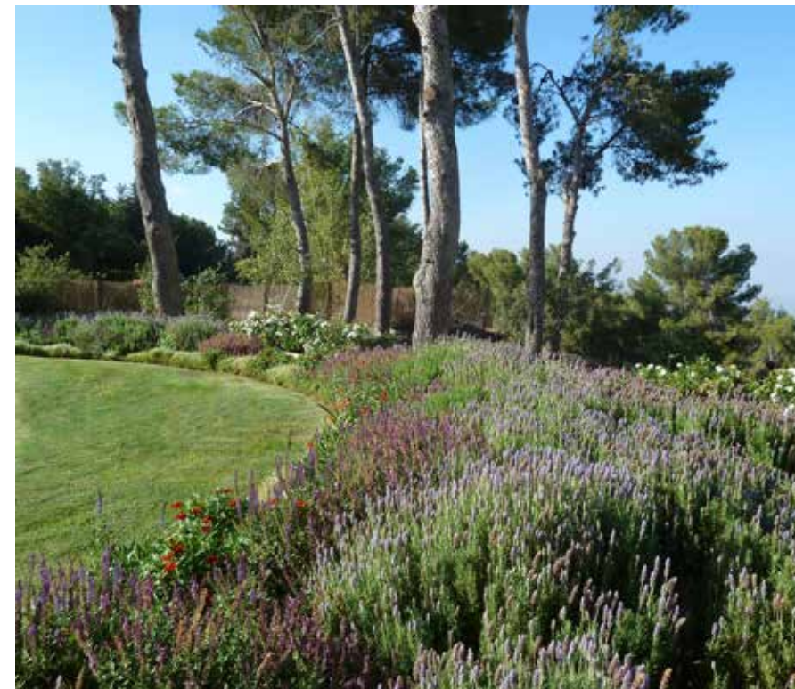
מרבד של לבנדרים ומרוות.