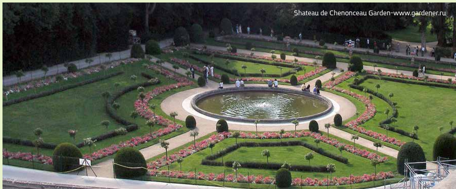
Shateau de Chenonceau Garden