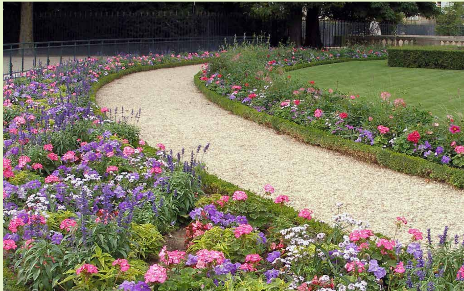
jardin du Luxembourg- www.gardener.ru