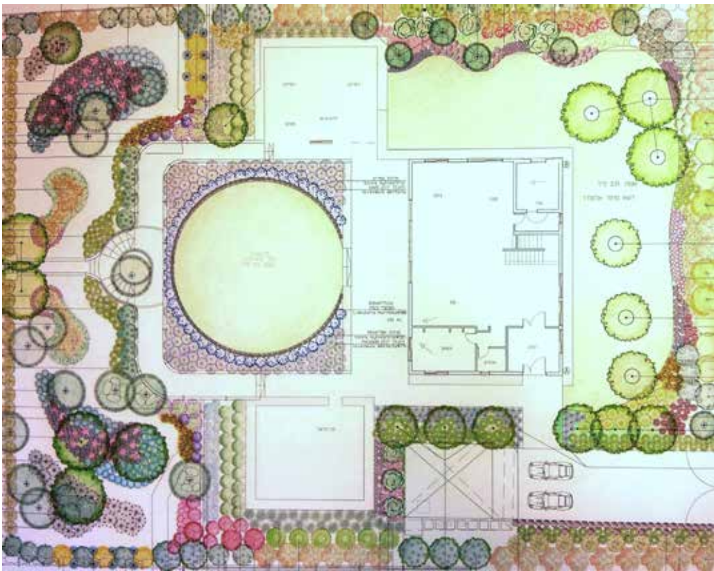
תכנית צמחייה ומבנה הגן.

הבית והגן ממוקמים בהרי הגליל העליון, בשטח הגובל ביער אורנים רחב ידיים המקיף את הישוב. מחד, תנאי פתיחה טובים לתכנון גן בסגנון הרצוי שכולל את הצמחייה המבוקשת, ומאידך, תנאי הקרקע, האקלים המקומי ועצי אורן וברוש שהיו קיימים בשטח דרשו חשיבה והתחשבות מיוחדת. בשלב הראשון קבענו ציר מרכזי לגן- ציר ש"נמתח" מרחבת היציאה מהסלון, עובר דרך גן פתוח ורחב ומוביל לכיוון החורש הטבעי שבהמשכו. אחד מעצי האורן הקיימים שהיה קרוב מאד לציר זה, הכתיב יצירת מפלס עם מדרגות מעוגלות סביבו, וכך, למרות שמיקומו של העץ יצר סטייה קטנה מהציר המדויק, השלמנו איתה וסימנו יו על מאפיין ראשון ומשמעותי של זרימת הגן. עץ זה, אגב, נשמר בקפידה במהלך ביצוע עבודות הפיתוח והבניה בשטח, ומטבע הדברים כל יתר העצים הקיימים בגן הם שקבעו את גובהו של המפלס התחתון.