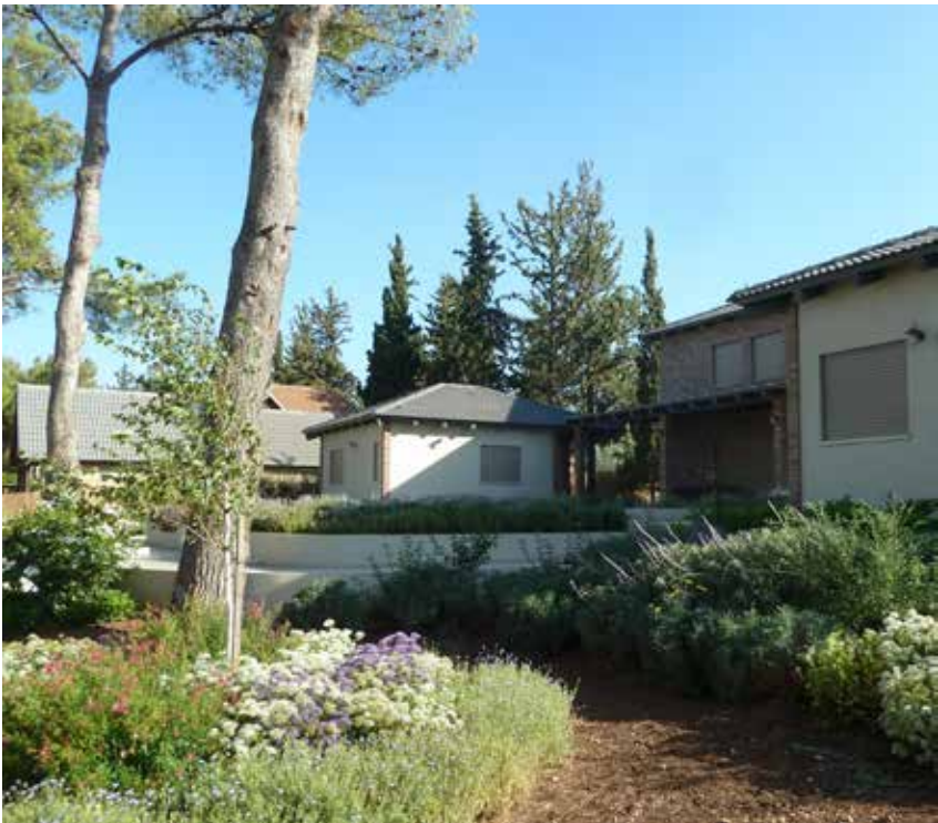
שני מפלסים עיקריים לגן- העליון פורמלי והתחתון מתמזג עם טבע הקיים.