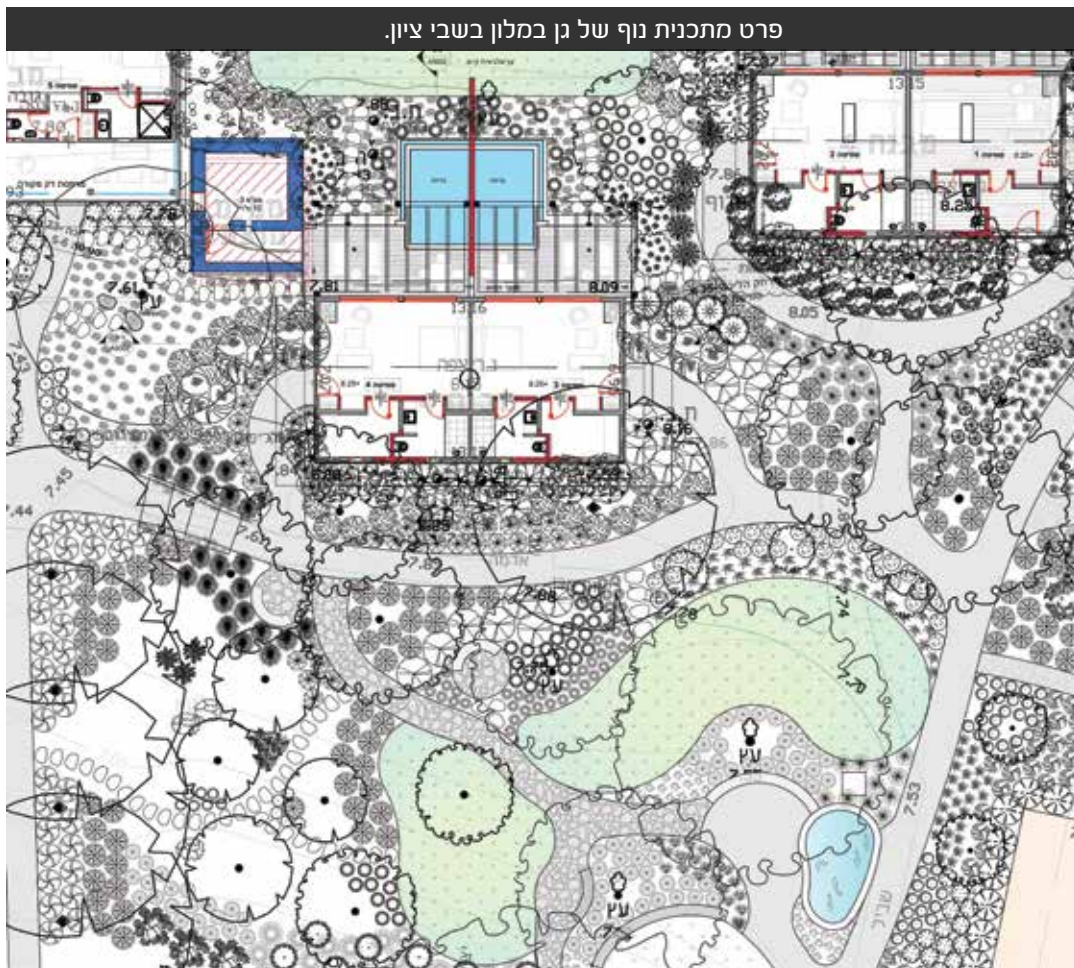
פרט מתכנית נוף של גן במלון בשבי ציון.

"ציפורים בבוקר, מוזיקה שקטה, ספר טוב בלי טלפונים, מיץ פירות או תה צמחים מהגן, ריחות נעימים, קפה שהביאו לי עד השולחן מתחת לעץ..." -אלה היו הגדרות שקיבלנו מיזמי הפרויקט בשבי ציון עבור הגן ששטחו משתרע על כ-25 דונם, שאנו שוקדים עתה על הגשתו. הפיכת שטח כה גדול לגינה עוטפת ונעימה, המאופיינת בפשטות ובנוחות תנועה ומשלבת בשטחה מוקדי עניין מגוונים אינה משימה פשוטה. לכן הרעיון היה ליצור שבילים שמתפתלים בין עצים (מהם ותיקים ומהם חדשים שניטעו במסגרת התכנון), מזמינים ומובילים אל אזורים שונים: בריכות נוי עם דגי זהב ושושני מים; בוסתן עם עצי פרי שונים שנועד לשמש גם את מטבח המלון וגם את האורחים; פינות ישיבה מוצלות; "אמפי" עם אפשרות להקרנת סרטים תוך ישיבה על הדשא; ושתילת מגוון רחב של עצי פרי וסוגי צמחייה מתאימים לאקלים המיוחד של מישור החוף. אלה נועדו ליצור חגיגה לחושים שונים ולהשלים כראוי את חויית השהיה במקום, בו כל אורח יוכל לבחור לעצמו את סוג הביטוי המועדף עליו- מנוחה והתרגעות שלווה בפינה אינטימית בגן, ולחלופין הצטרפות למסיבת חוף לילית עם הפרחת פנסים, בלונים ומוזיקה מדליקה. ■