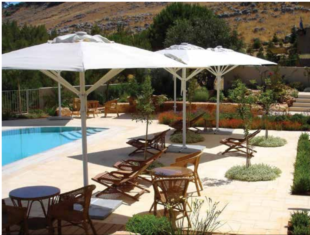
רחבת בריכת שחייה במלון בוטיק אחוזת יסמין.

הגן של "אחוזת יסמין" הוא גן עם נגיעות קלות של סימטריה - במרכז החצר ממוקמים בריכת השחייה וארבעה עצי תפוח ששתילתם בצורת ריבוע יוצרת סביבה מוצלת ונעימה עבור המתרחצים. בעונת הקיץ ניתן גם לקטוף את פירותיהם כהנאה נוספת, ועץ דובדבן שנשתל בגן משמש לרקיחת ריבות הבית של המקום ומשמח עיניים בימי פריחתו. שבילי מסתור מובילים לעוד הפתעות: ערוגות צמחי תבלין, ערוגות של תות שדה וסלע- ספסל בצלו של עץ זית. הסאונה המיוחדת ששולבה בשטח עשויה בשיטת בניית בוך "אדובה", וחזותה היא כשל יצירת אמנות המעשירה את המראה. תחלופת העונות בגן של אחוזת יסמין היא חלק עוצמתי במופע המקום, כשקירות המלון נצבעים כל פעם בכוונים שונים. מעבר לעיצוב המוקפד של הפנים, בריכת השחייה והסאונה בכל אחד מבתי המלון, תגלו כאן עוד דברים: בתמרון, למשל, יגישו לכם ארוחה גלילית אותנטית, מעשה ידיהן של נשים מקומיות, ואם תרצו - יגיע שף לבשל עבורכם ארוחה פרטית. באחוזת יסמין מוצגות תערוכות אמנות המתחלפות מידי כמה חודשים, לעתים נערכות במקום כיתות אמן מרתקות.