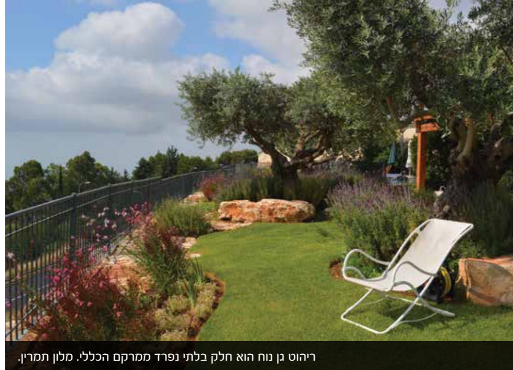
ריהוט נן נוח הוא חלק בלתי נפרד ממרקם הכללי. מלון תמרין.