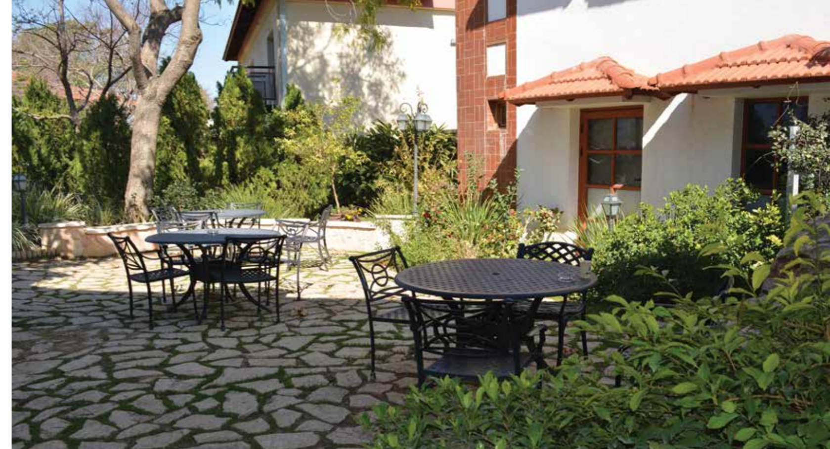
גן קטן עוטף בכניסה ראשת של בית מלון פסטורל- כפר בלום. משמשת את האורחים בזמן המתנה

מלונות בוטיק תמרין ואחוזת יסמין זכו להתמקם בנקודות תצפית נחשקות ביותר, אל מול נוף שפונה לרמת הגולן, לחרמון והכינרת, כאשר קרבתם לראש פינה הוותיקה על ההיסטוריה העשירה שלה ואופייה המיוחד מוסיפה עוד צבע למקום. יש סוג של דמיון בין שני הגנים: מופעם מאופיין בזיקה לסגנון הים תיכוני שבא לידי ביטוי בבחירת הצמחייה המתאימה ובשימושי החומרים - אבן גיר מקומית ומעט בזלת בשבילים וקירות תמך.