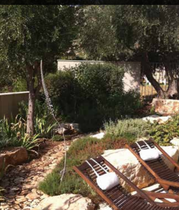
שביל קטן המוביל לחלקת תות שדה ותבלינים. אחוזת יסמין.