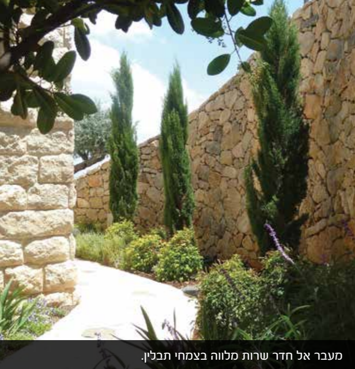
מעבר אל חדר שרות מלווה בצמחי תבלין.