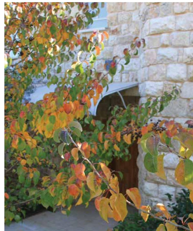
עצי אגס קלריאנה בשלכת עוטפים ברכות את הכניסה לאחוזת יסמין. אדריכל בני ארליך