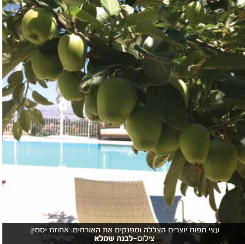
עצי תפוח יוצרים הצללה ומפנקים את האורחים. אחוזת יסמין.