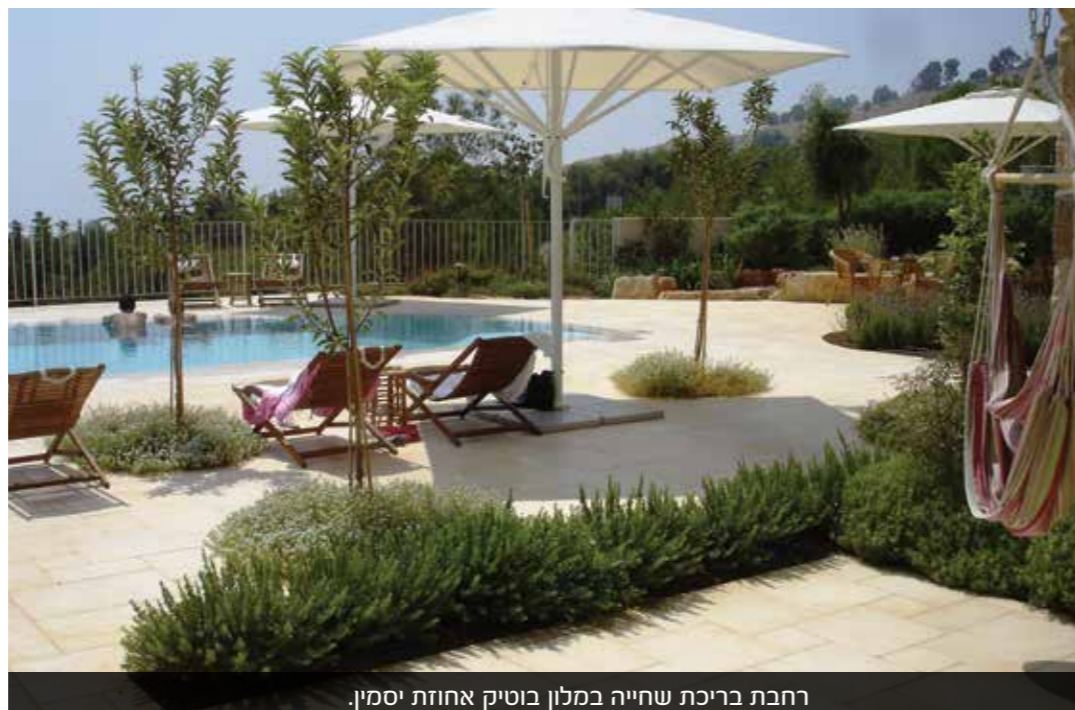
רחבת בריכת שחייה במלון בוטיק אחוזת יסמין.