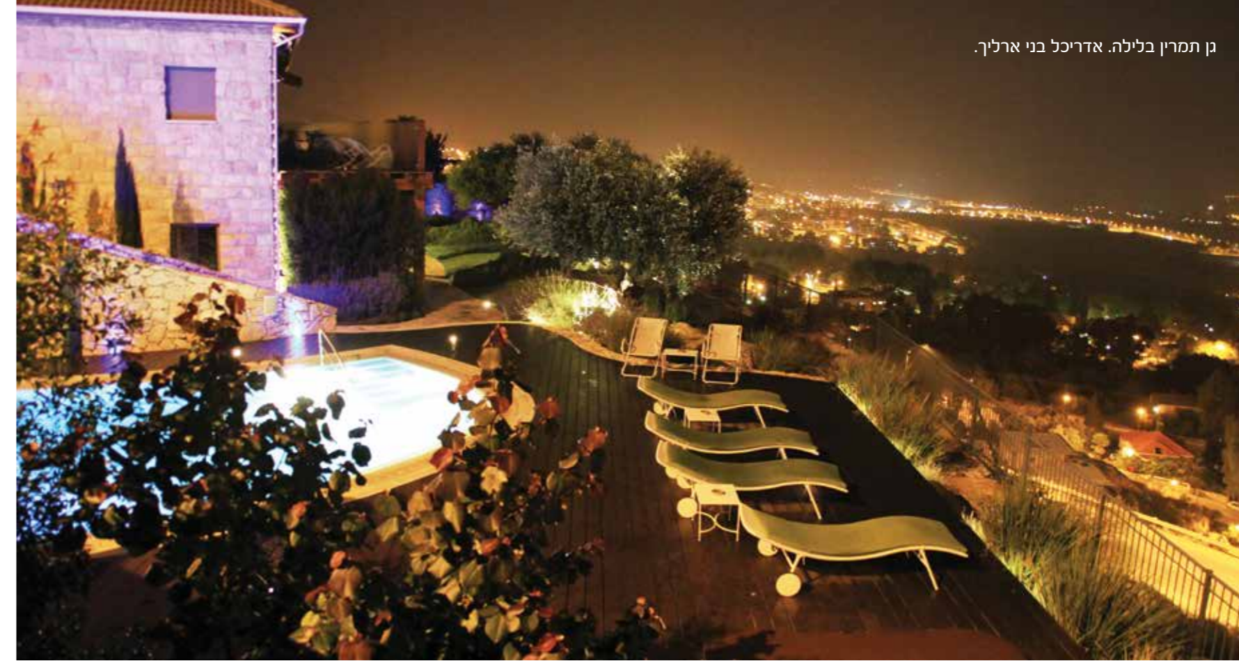
גן בדגש על סגנון ים תיכוני- עצי זית, סוגים שונים של אזוביון, צמחי תבלין. מדשאות פרטיות מהוות חלק ממרחב הכללי של הגן. מלון תמרין.