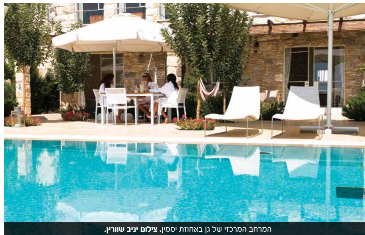
המרחב המרכזי של גן באחוזת יסמין.