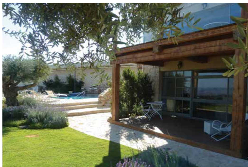
גן בדגש על סגנון ים תיכוני- עצי זית, סוגים שונים של אזוביון, צמחי תבלין. מדשאות פרטיות מהוות חלק ממרחב הכללי של הגן. מלון תמרין

הגן של תמרין בנוי על שני עקרונות מנוגדים כביכול: פשטות ויוקרה בו זמנית. עצי זית עתיקים, סוגים שונים של מרות ולונדרים לצד צמחייה נוספת, מעטרים ומרככים ברגישות את החלק הבנוי של הגן, כאשר השילוב הנכון בין אדריכלות הנוף (מבנה הגן) לבין הצמחייה יוצר מגוון של נקודות עניין: מתחם של בריכת שחייה עם פינקים משלה, מדשאות פרטיות, פינות ישיבה מוצלות, "טיילת" ומרפסות עם תצפית אל נוף מרהיב, וכן מטבח חוץ לארוחות בנן.