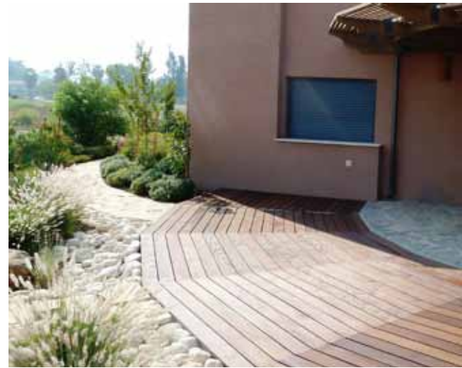
פינת ישיבה בקדמת הגן