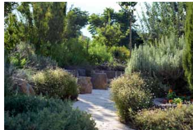
סלעי בזלת צומחים מתוך הקרקע