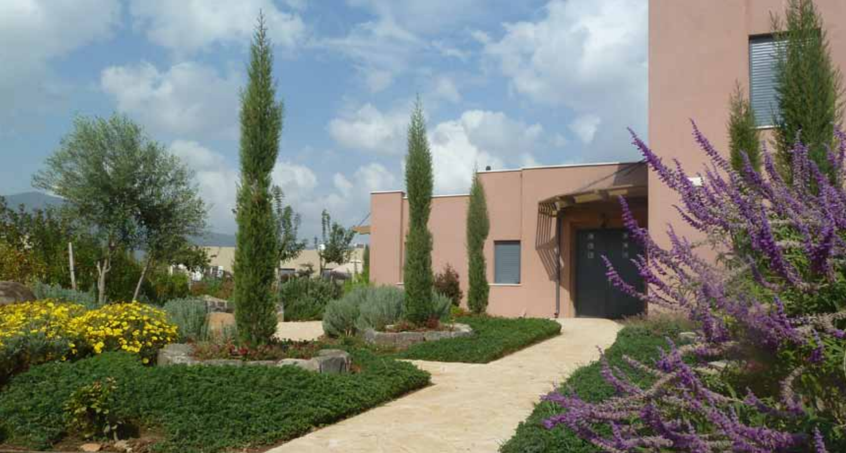
ברושים צריפיים מלווים את שביל הכניסה.

שהם מקפלים בחזותם, והם היו לנו השראה. על מנת ליצור חותמת סגנונית ברורה שתאגד את הדרישות המגוונות, נבחרו עצי ברוש צריפי כעין עמודים המלווים את שביל הכניסה ומגלמים בנוכחותם פורמאליות, מקצב וארומה ים תיכונית כאחד. כדי להדגיש את האמירה נבנו סביבם ערוגות מאבן בזלת מסותתת באופן סימטרי, ובתוכן נשתלו צמחי עונה בצבע אדום - כתום המדגישים את הירוק העמוק של הברושים הזקופים. מרבד של חבלבל מאורטני מאחד באופן סימטרי את הממד האופקי, והוא נגזם בקפידה כרצף לקווי הריצוף ובקו אבני הבזלת התוחמים את עצי הברוש. חלקו העליון מאידך, הנושא פרחים בעונת הקיץ, נותר ללא גיזום במראה פראי.