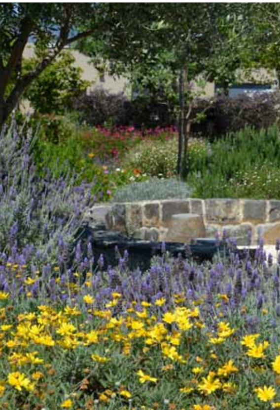
צמחיה ים תיכונית חזקה וחסכונית במים