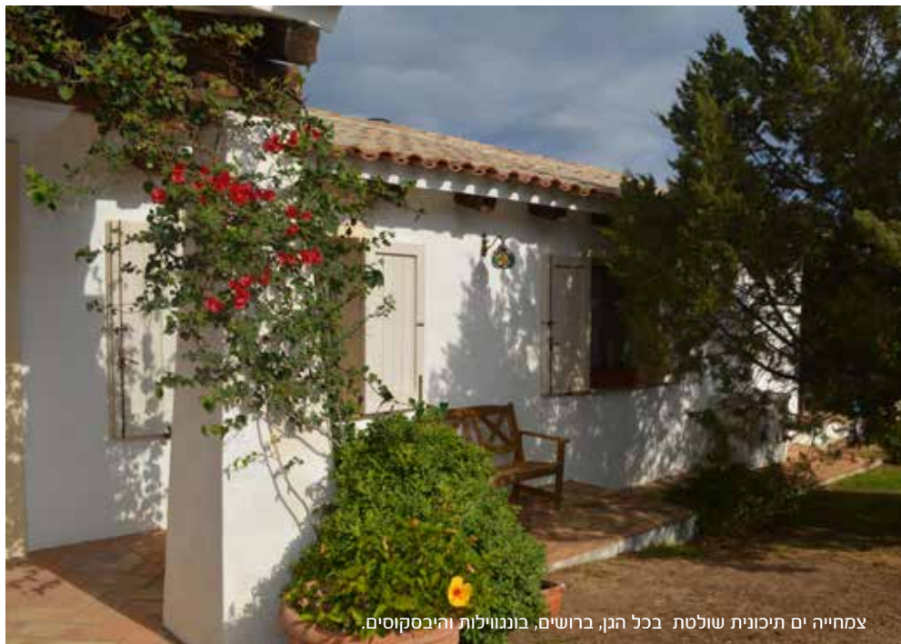
צמחייה ים תיכונית שולטת בכל הגן, ברושים, בוגנוויליות והיביסקוסים.