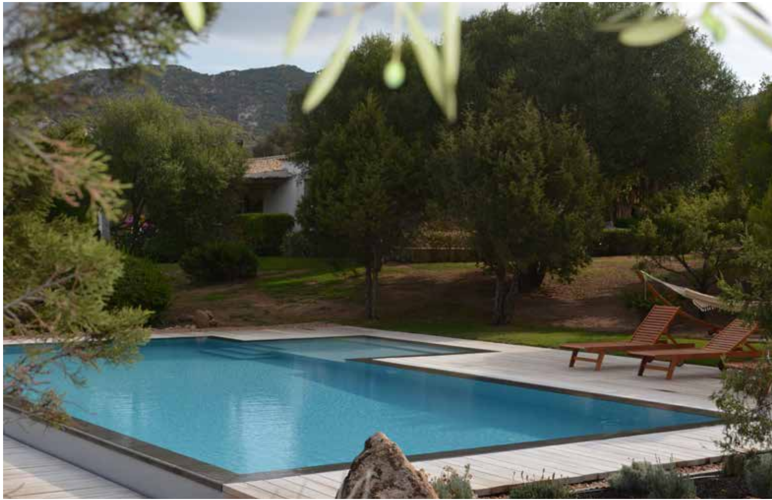
בריכת שחייה משתלבת במראה הגן.

בהמשך ביקורנו ברחבי סרדיניה, נחשפנו למקומות רבים נוספים - ערים, עיירות וכפרים. בכל מקום כזה, מרכזי או נידח יותר, שבנו ופנשנו את אותה בנייה מוקפדת באבן מקומית, את השימוש בסלעים כחלק בלתי נפרד מהגן, וצמחייה חד גונית כביכול, אך מאוד שייכת לאגן הים התיכון. בין אם מדובר בשכונות של בתי עשירים, ובין אם בכפרים קטנים ונידחים, כולם נושאים ניחוח מקומי שעיקרו כבוד למסורת וככזה הוא מעורר כבוד רב.