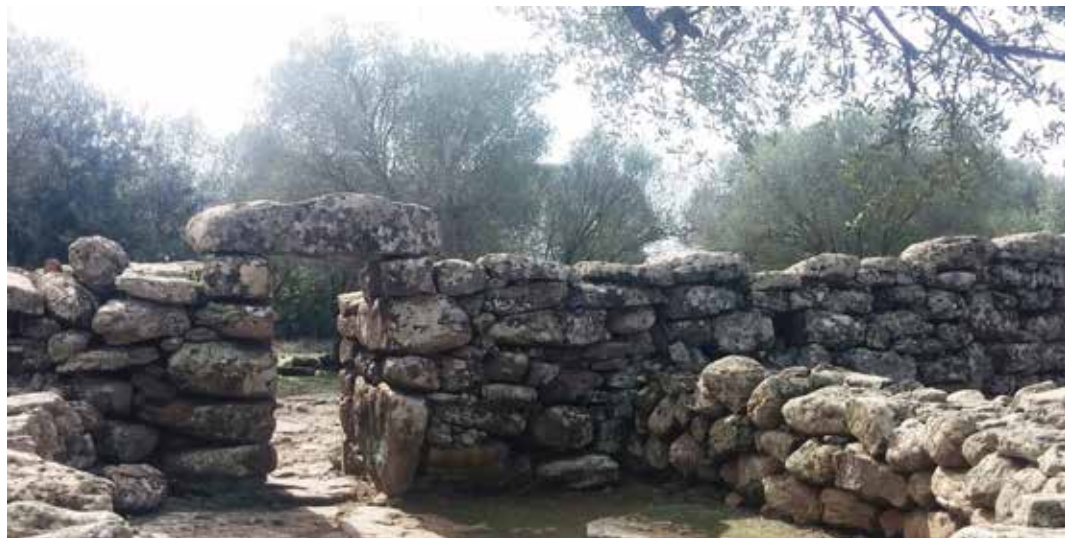
דוגמאות מבניית גנים מסורתיים ברחבי סרדיניה.