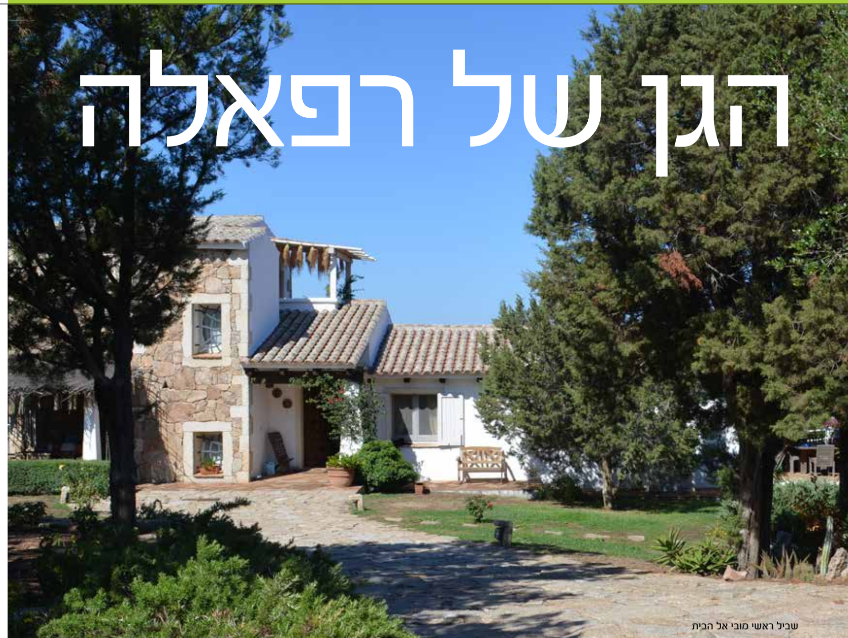
שביל ראשי מובי אל הבית